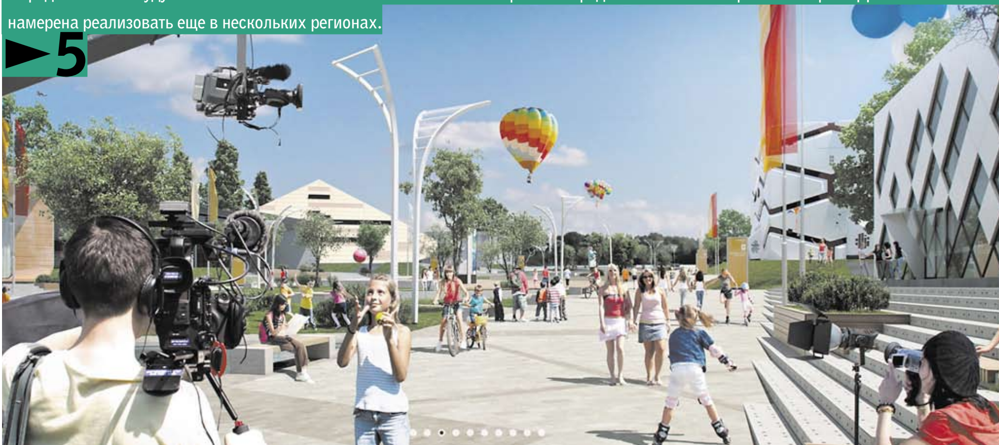
Так, по замыслу разработчиков, должен будет выглядеть лагерь нового уровня.