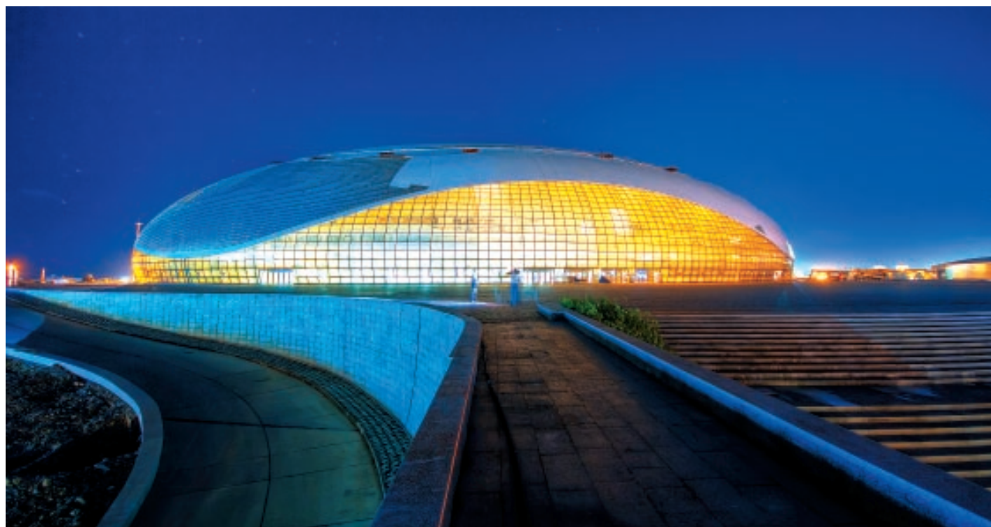
СПОРТИВНЫЕ ПРОЕКТЫ — ОЛИМПИАДА И ЧЕМПИОНАТ МИРА ПО ФУТБОЛУ - ГАРАНТИРУЮТ ЮГУ ПРИТОК ИНВЕСТИЦИОННЫХ СРЕДСТВ ЕЩЕ НА НЕСКОЛЬКО ЛЕТ ВПЕРЕД

ИНФРАСТРУКТУРНЫЙ БУМ В 2012 году юг России пополнил свой инвестиционный портфель новыми спортивными инвестпроектами: подготовкой Сочи и Ростова-на-Дону к чемпионату мира по футболу 2018 года. Таким образом, поток средств из федерального бюджета гарантирован югу еще на несколько лет вперед, хоть и в меньшем объеме — с расходами на Олимпиаду, которую называют самой дорогой в истории, вряд ли что-то может сравниться. Донские власти уже подали заявку в федеральный бюджет на выделение 91 млрд рублей для финансирования подготовки к чемпионату. По оценкам губернатора области Василия Голубева, это около 70% регионального годового бюджета. Как и в Сочи, в котором наравне со спортивными объектами появляется новая инфраструктура, дороги, гостиницы, в Ростове тоже заявлены крупные инфраструктурные и коммерческие проекты. Из 91 млрд рублей, которые регион просит на подготовку из федерального бюджета, 22 млрд рублей могут составить инвестиции в дорожное строительство.