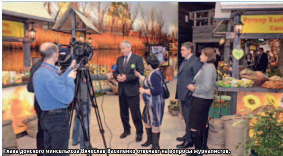
Глава донского минсельхоза Вячеслав Василенко отвечает на вопросы журналистов.