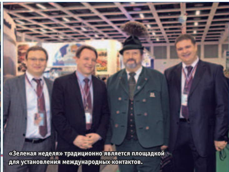
«Зеленая неделя» традиционно является площадкой для установления международных контактов.