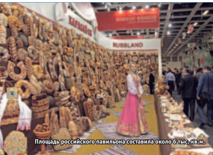
Площадь российского павильона составила около 6 тыс. кв.м.

Что же касается рядовых посетителей, то для них «Зеленая неделя» – отличная возможность в границах выставочного комплекса совершить кругосветное кулинарное путешествие.