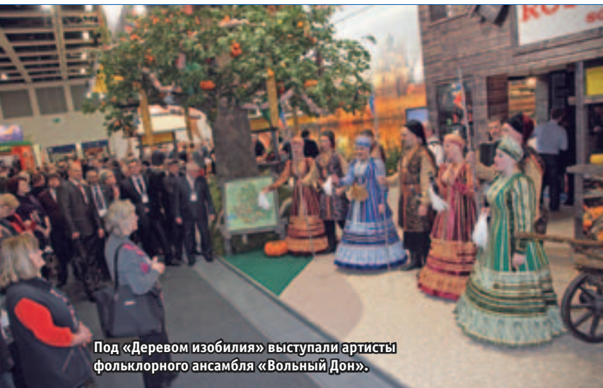
Под «Деревом изобилия» выступали артисты фольклорного ансамбля «Вольный Дон».