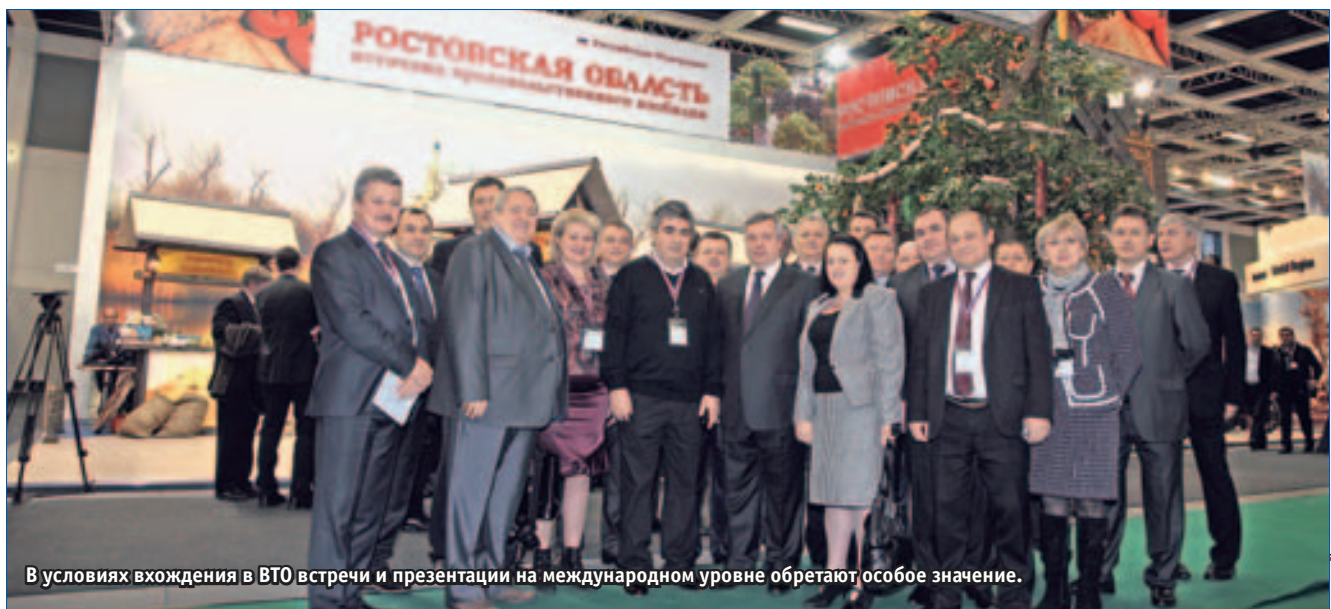
В условиях вхождения в ВТО встречи и презентации на международном уровне обретают особое значение.