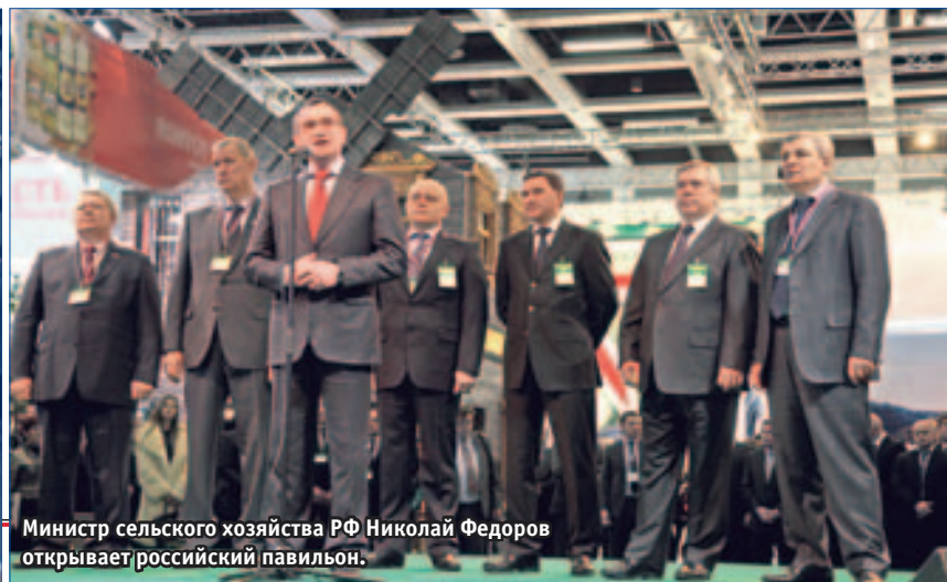
Министр сельского хозяйства РФ Николай Федоров открывает российский павильон.