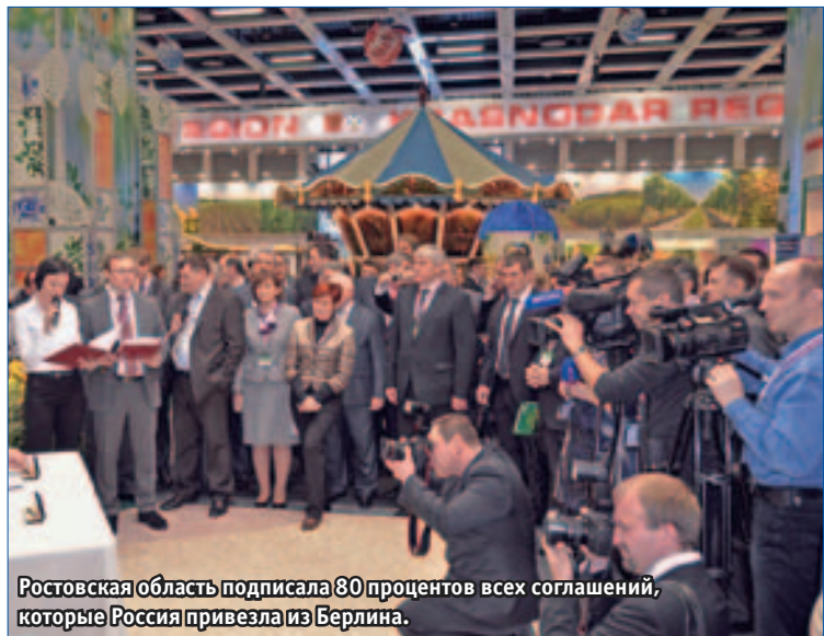
Ростовская область подписала 80 процентов всех соглашений, которые Россия привезла из Берлина.