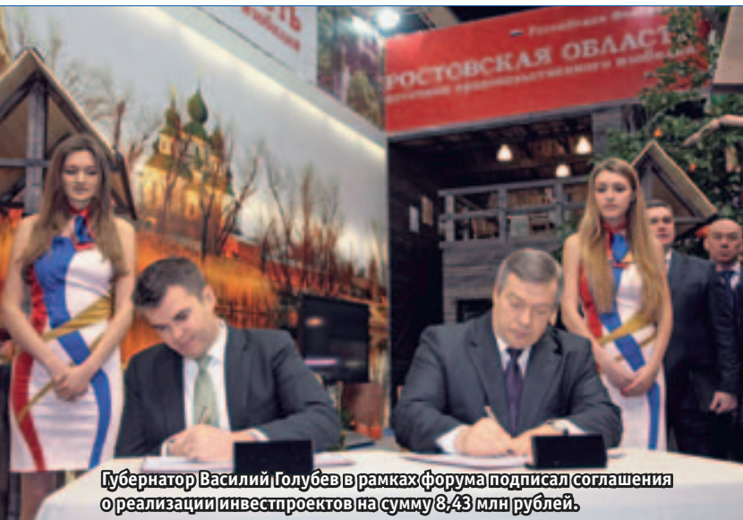
Губернатор Василий Голубев в рамках форума подписал соглашения о реализации инвестпроектов на сумму 8,43 млн рублей.