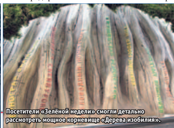
Посетители «Зелёной недели» смогли детально рассмотреть мощное корневище «Дерева изобилия».